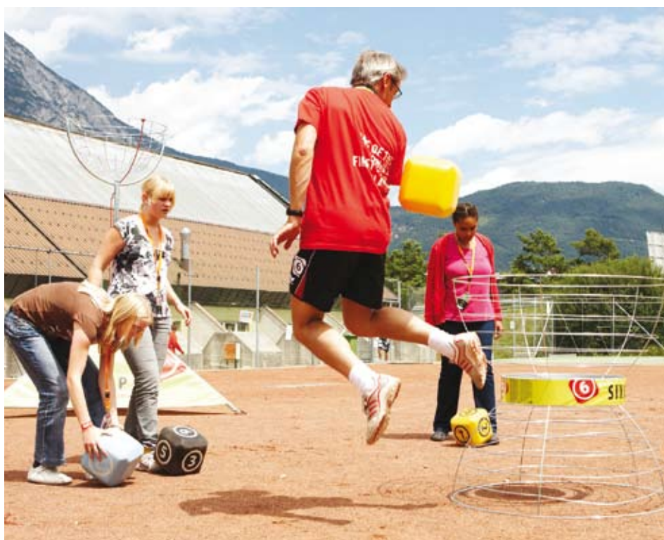
Die Tennisplätze neben der Kuppelarena wurden bei den ASVÖ Jugendspielen zum „Six-Cup-Stadion“