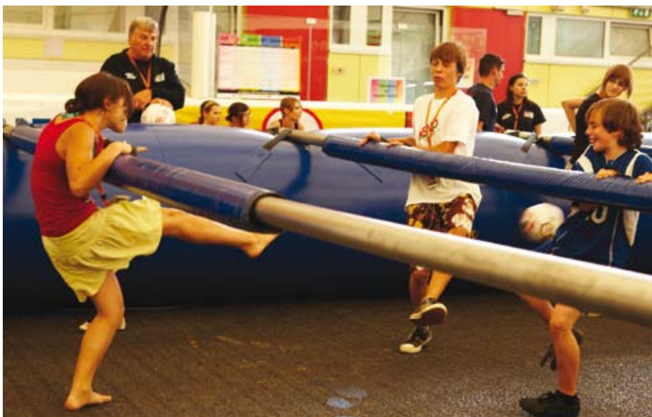
Stangen-Wuzzeln: „Man denkt, man ist ein Plastikmänderl, gleich wie beim Tischfußball“

09.00–12.00 Uhr 14.00–17.00 Uhr Mannschaftsbewerb Tennisanlage Birkenberg Telfs